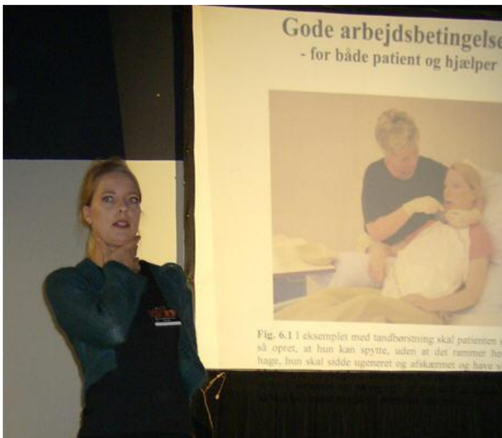
Kap. 6: Dataindsamling