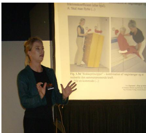
Om kap. 1: Dynamik og biomekanik