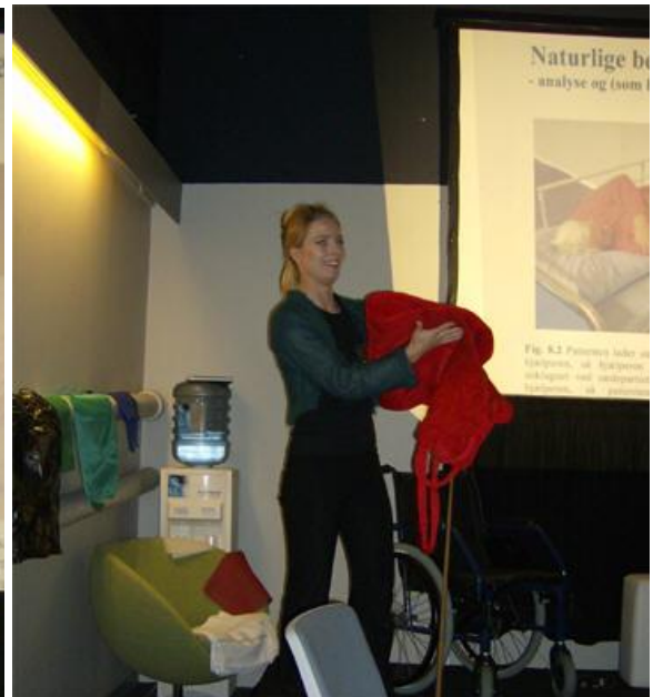
Kap. 8: Naturlige bevægelsesmønstre og forflytningseksempler - samt glidestykker i massevis, inkl. en simpel plastikpose