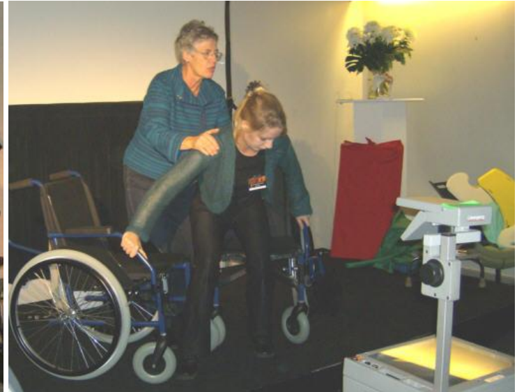
I baggrunden ses et langt glidebræt og et udvalg af mindre glidebrædder