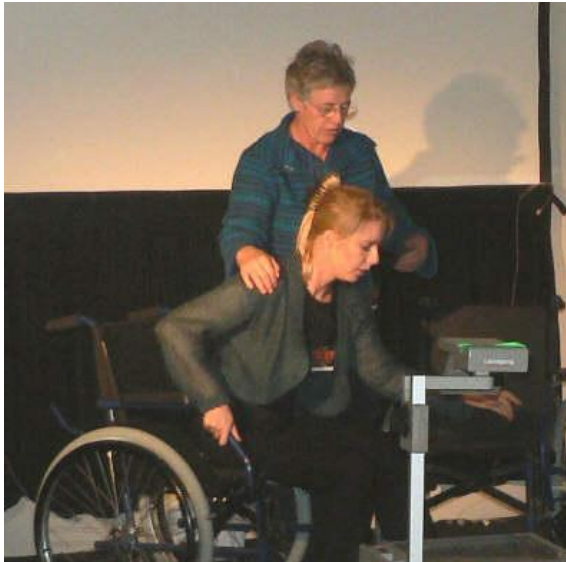
Demo af forflytning mellem to stole med let assistance.